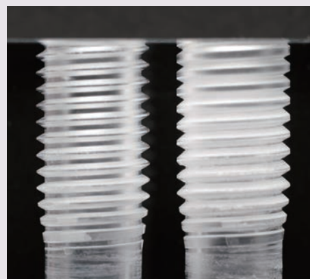
左:SYFN 右:コレットチャック

With the Synchro Tap infinitesimal float is used, increasing the degree of transparency, thereby illustrating the accuracy of threads are improved.